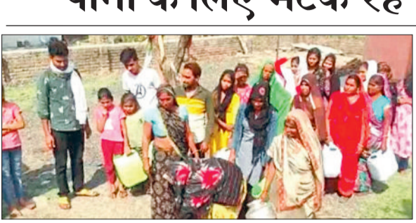
पहले से परेशानी

ग्रामीण इलाके में पेयजल मुहैया कराने लाखों की लागत से पानी टंकी का निर्माण एवं पाईप लाईन का विस्तार किया जा रहा है पर जल की कमी के चलते ग्रामीणों को पेयजल के लिए रोज जदोजहद करना पड़ रहा है। प्राप्त जानकारी अनुसार ग्राम पंचायत खैरा नवापारा के आश्रित ग्राम बेलगांव में ग्रामीणों की पेयजल समस्या दूर करने घर नल एवं पाईप लाईन का विस्तार किया जा चुका है। लाखों की लागत से पानी टंकी का निर्माण किया जा रहा है। पानी टंकी के निर्माण में हो रही देरी को देखते तथा पेयजल सप्लाई करने कुछ माह पहले बोर से डायरेक्टर पाईप लाईन के माध्यम से पेयजल उपलब्ध कराया जा रहा था जो अब माह भर से बंद है।